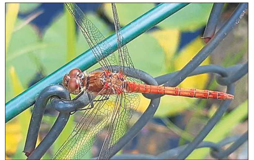
„Bei Sonnenschein lassen sich die Libellen wieder sehen“, hat Theo Steiling aus Beelen festgestellt und diese Frühe Adonislille im Bild festgehalten.