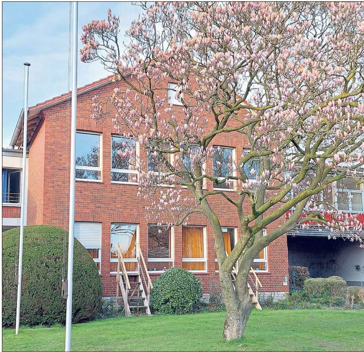
Die ehemalige Grundschule in Beelen, hier eine Teilansicht von der Straße Osthoff, wird aktuell als Flüchtlingsunterkunft genutzt.