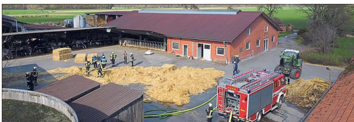
Auf diesem Hof in der Bauerschaft Versmar war Stroh in Brand geraten.